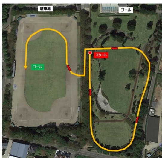
親子の部(幼児) 約800mコース